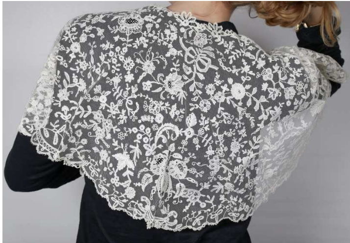
Un mantelet en Application, Point à l'aiguille, XIXème siècle 150/200 €