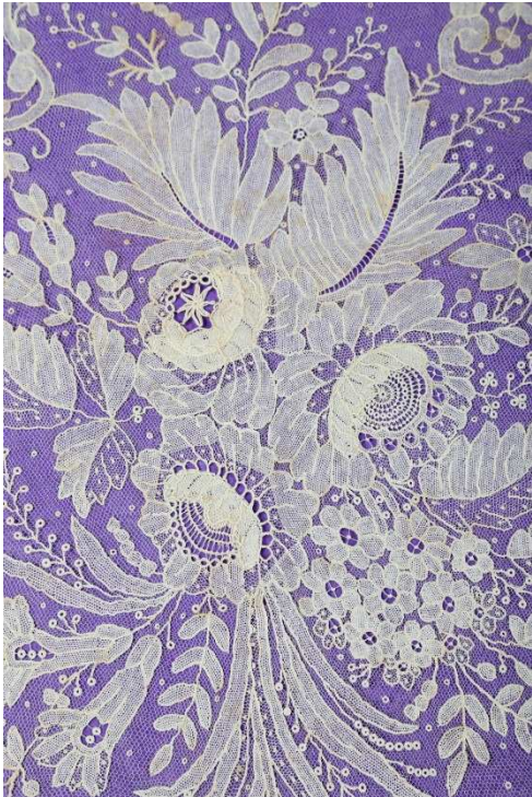
Une grande écharpe de mariée en Point à l'aiguille (accidents) 300/400 €